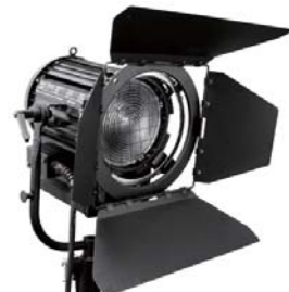
■ LSW-004 2000W