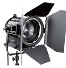
■ LSW-003 1000W