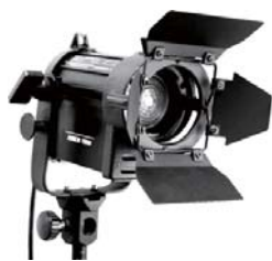
■ LSW-010 150W