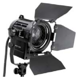
■ LSW-001 300W