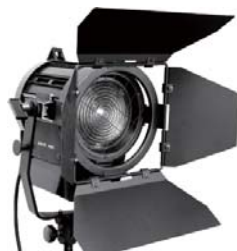
■ LSW-002 650W